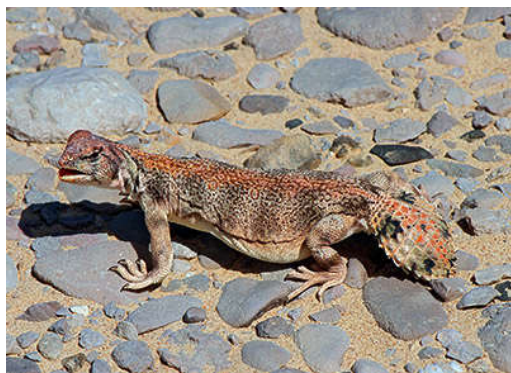
ZILGER, H.-J. & W. GROSSMANN: Titelbild: Uromastix thomasi Parker, 1930